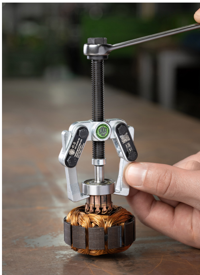
Abziehen eines kleinen Kugellagers von einer E-Motor-Welle mit dem 41-0