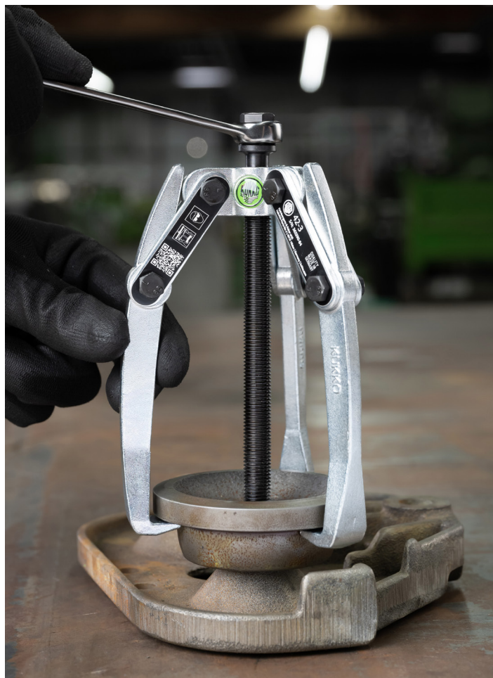
Demontage einer Umlenkrolle von einem Maschinenbauteil mit dem 42-3