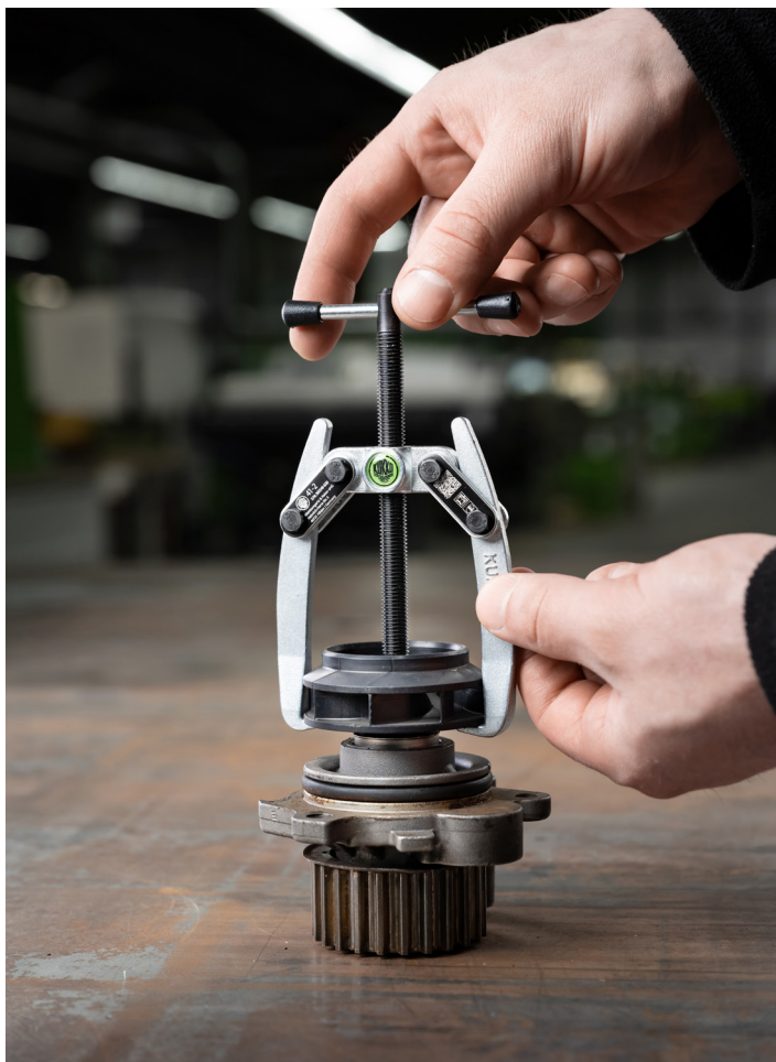
Abziehen eines Pumprads von einer Wasserpumpe am Auto mit dem 41-2