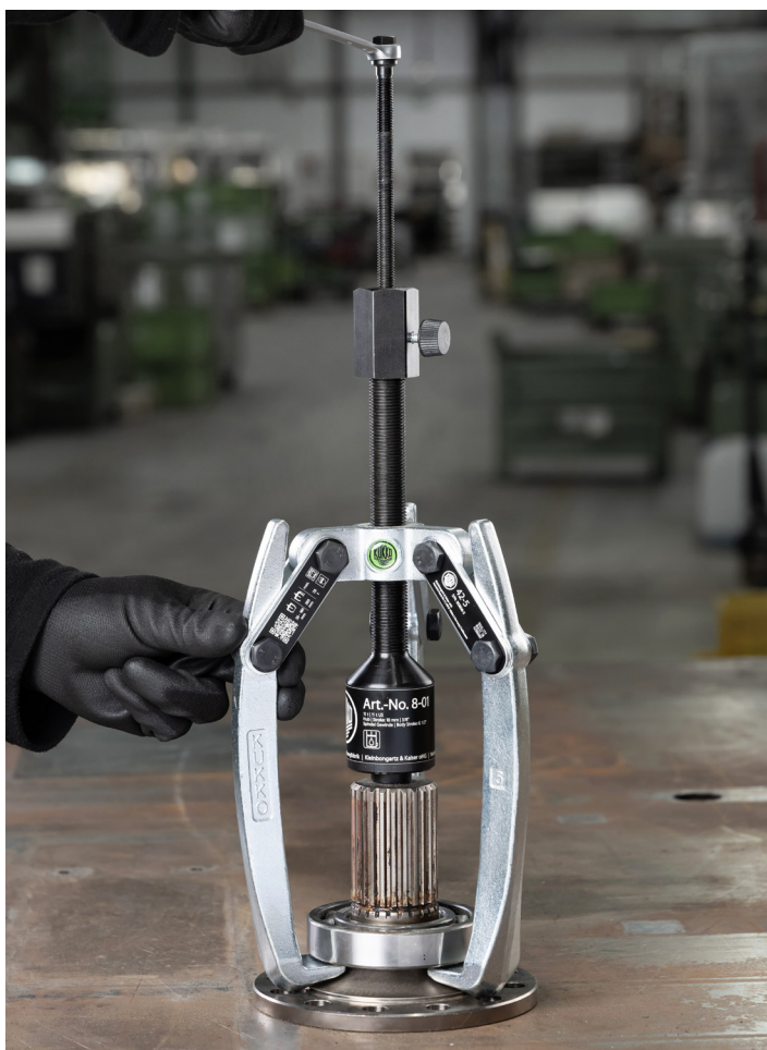
Kugellager-Demontage von einem Antriebswellenflansch mit Hydraulikspindel