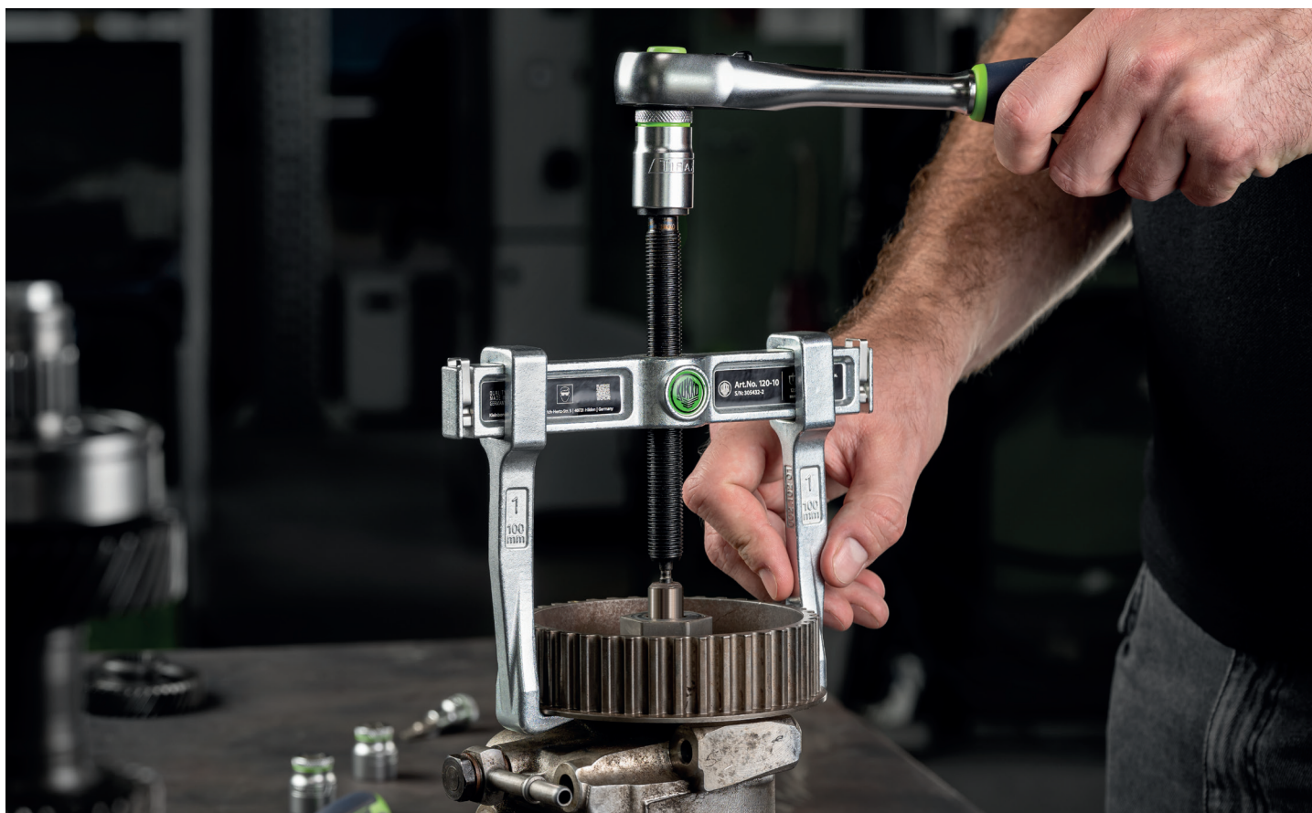
Abziehen eines Getriebezahnrades mit dem 120-10