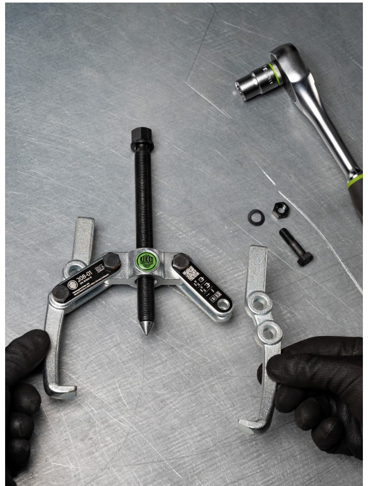
Umbau zur Anpassung der Spanntiefe und Spannweite am Beispiel des 208-01.