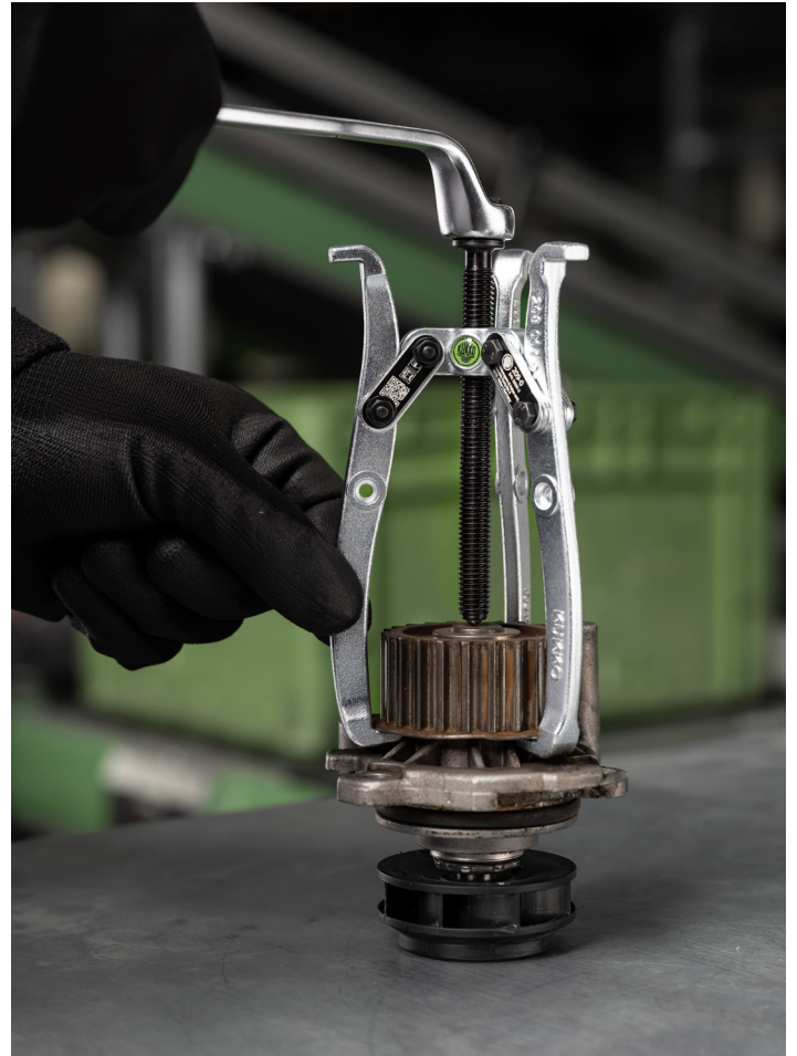
Abziehen eines Lüfterrades mit dem 209-0.