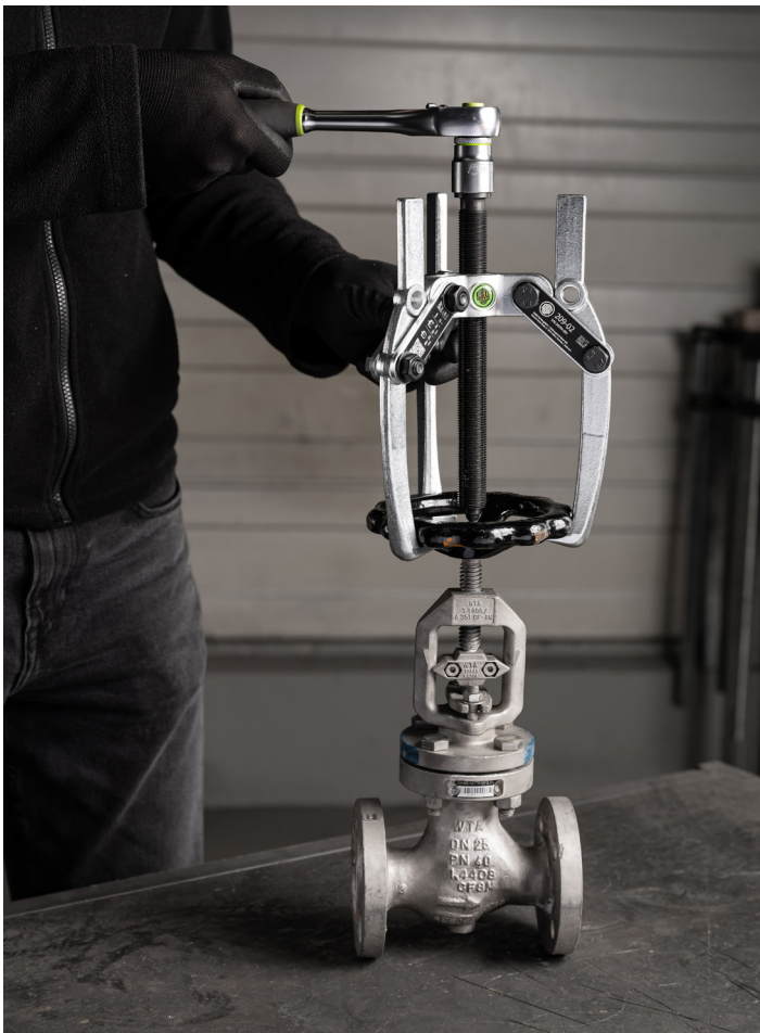
Abziehen des Handrades von einem Absperrventil mit dem 209-02.