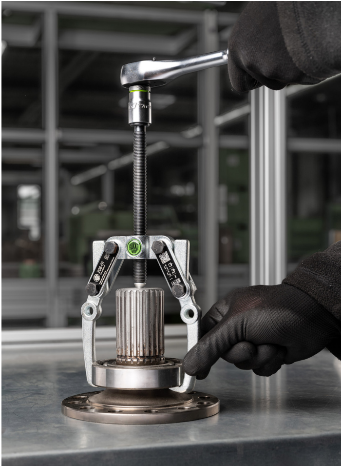
Abziehen eines Kugellagers von einer Welle mit dem 208-01.