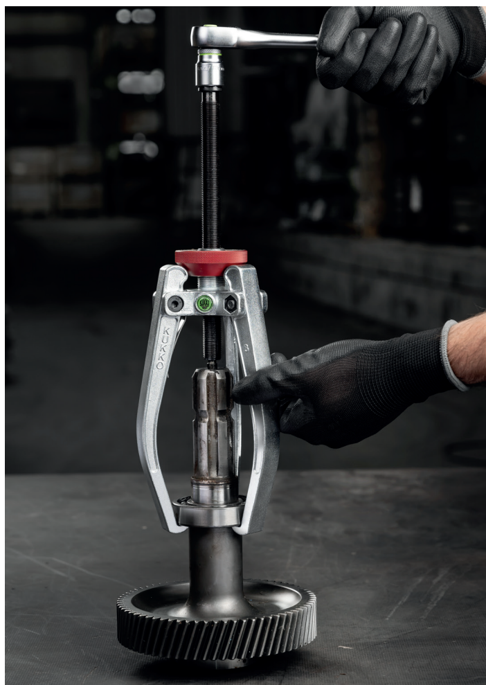
Der 3-armige Abzieher für Wälzlager 113-3 mit Konusrändel beim Abziehen eines Kugellagers an einem Getriebe