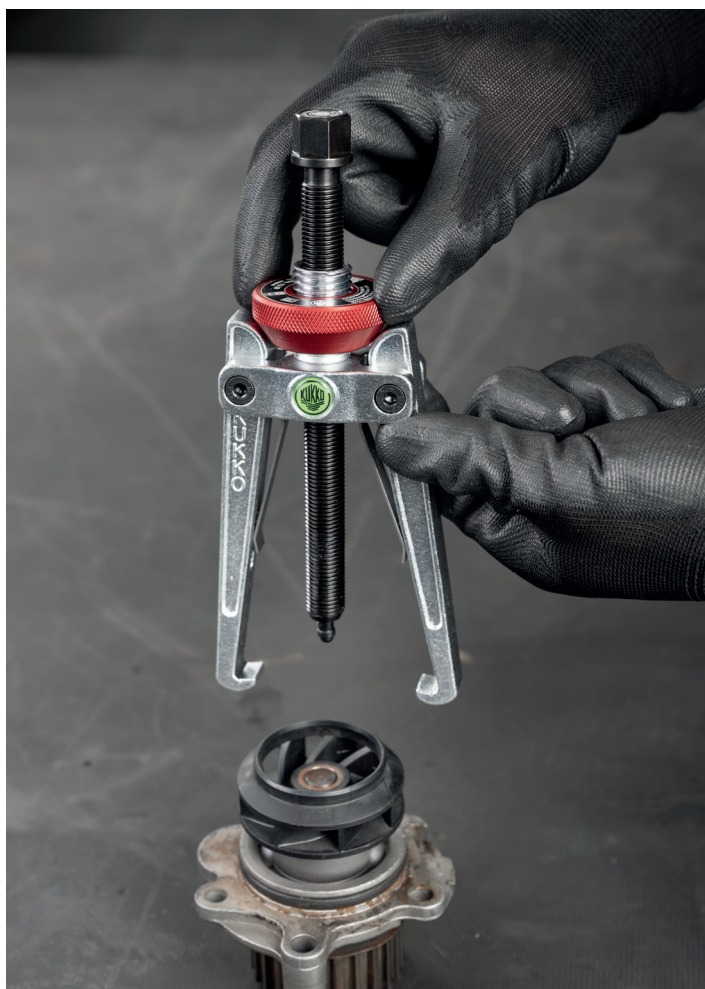
Der 2-armige Abzieher für Wälzlager 112-20 mit Konusrändel beim Abziehen eines Kugellagers an einer Wasserpumpe