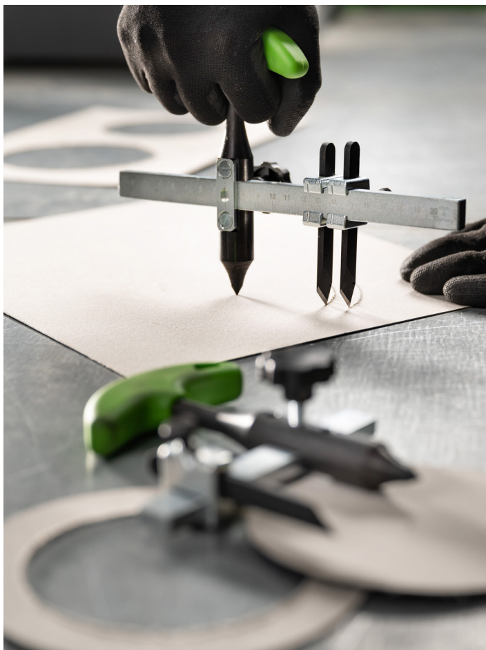
Ein Scheibenschneider mit 2 Messern der Baureihe 322 beim Schneiden von kreisförmigen Ausschnitten