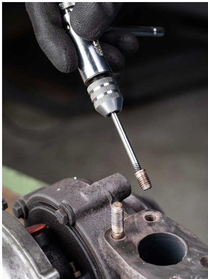
Ein Schraubendreher aus dem Schraubendreher-Satz 49-A hat eine Schraube sicher entfernt