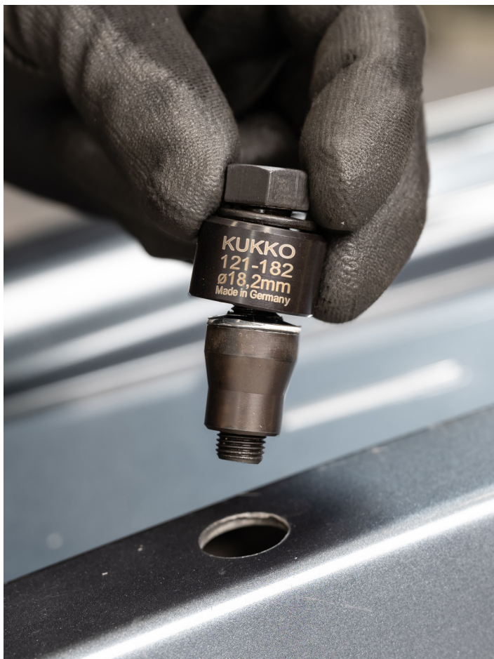
Der Schaublocher 121-182 wird durch das zuvor gebohrte Loch gesteckt