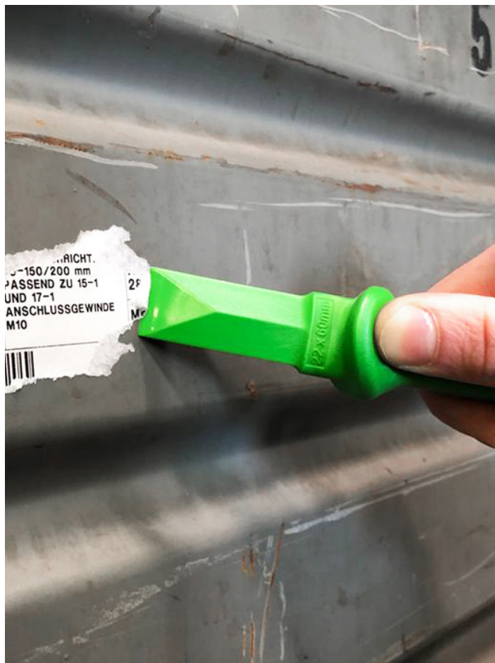
Ein Soft-Schaber der Baureihe 2200 beim schonenden Entfernen eines Produktaufklebers