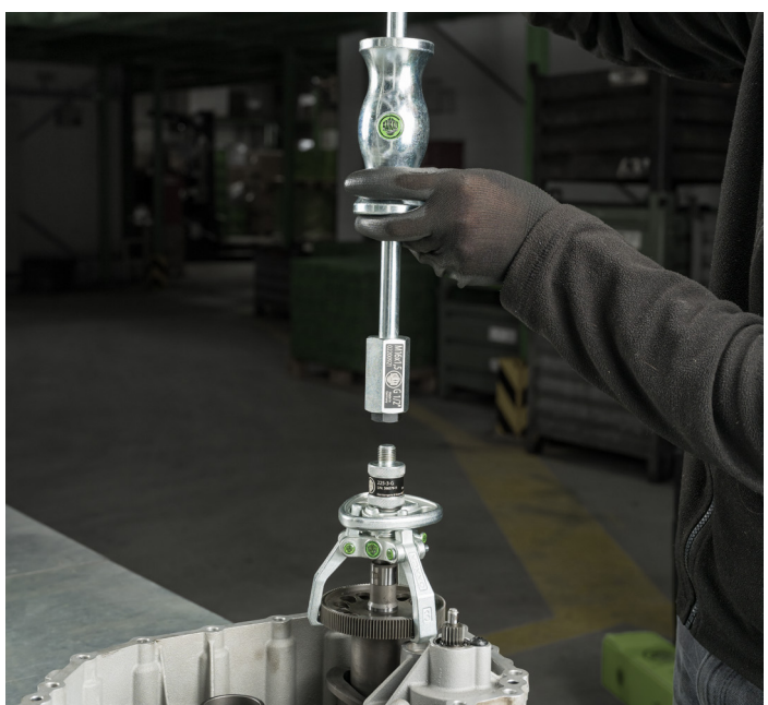
Verbinden des Gleithammers über den Gewindeadapter des Abziehers