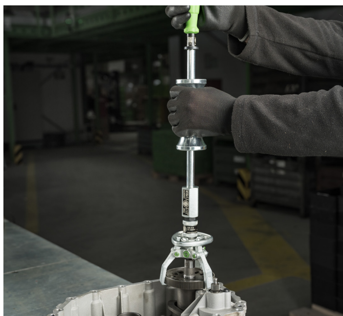
Demontage einer Riemenscheibe aus einem Getriebeteil