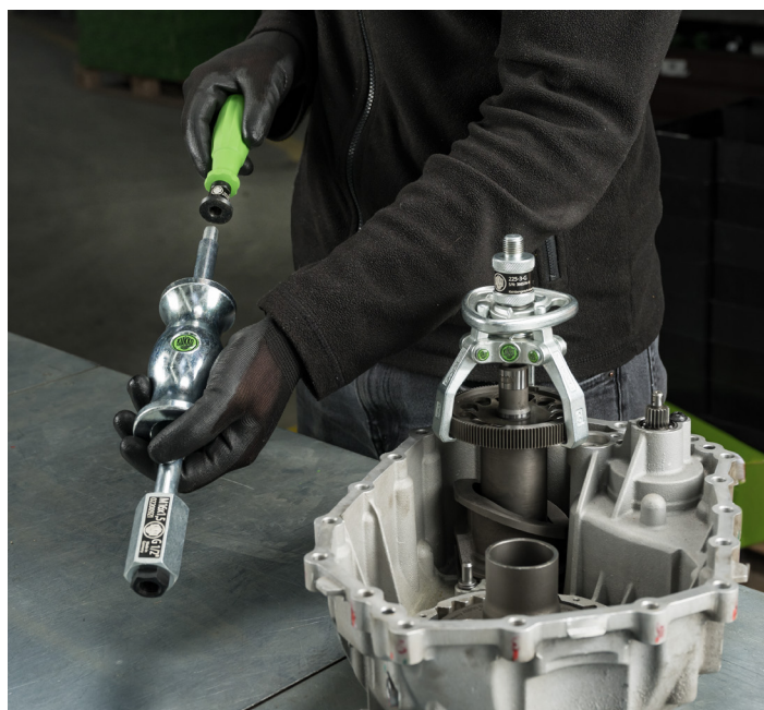
Anbringen des 3-K Griffes G-22 am Gleithammer