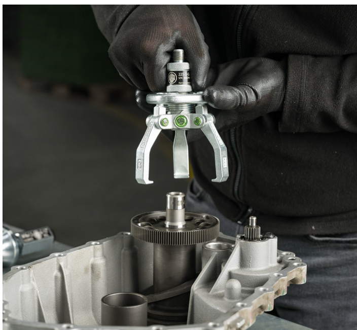
Ansetzen des Abziehers an das abziehende Bauteil