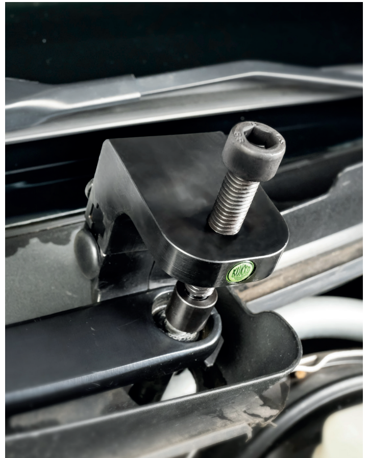
Abziehen eines Scheibenwischerarms mit dem 128-F-60