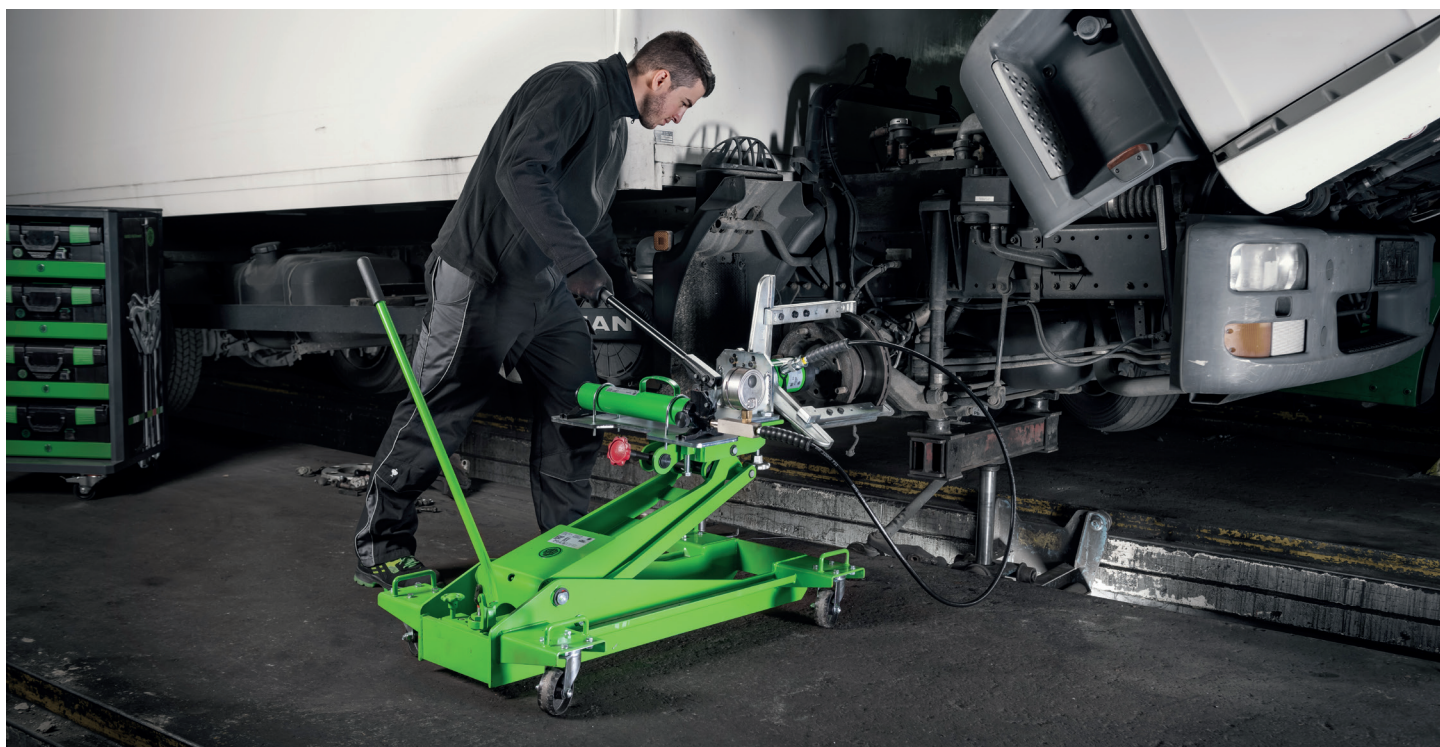
Der Mobile Hydraulik-Abzieher „DAVID“ in der Anwendung