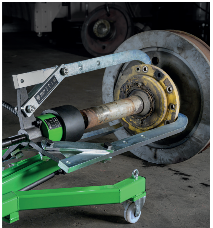
Der Mobile Hydraulik-Abzieher „GOLIATH“ Goliath-556 beim Abziehen eines festsitzenden Radlagers eines Hafenkranes